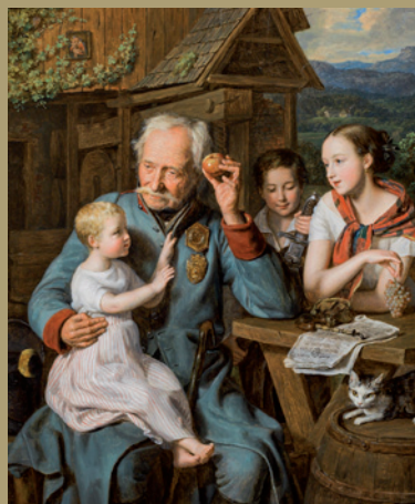
Ferdinand Georg Waldmüller verkauft um € 138.600