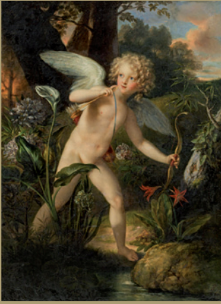
Carl Josef Agricola verkauft um € 120.960