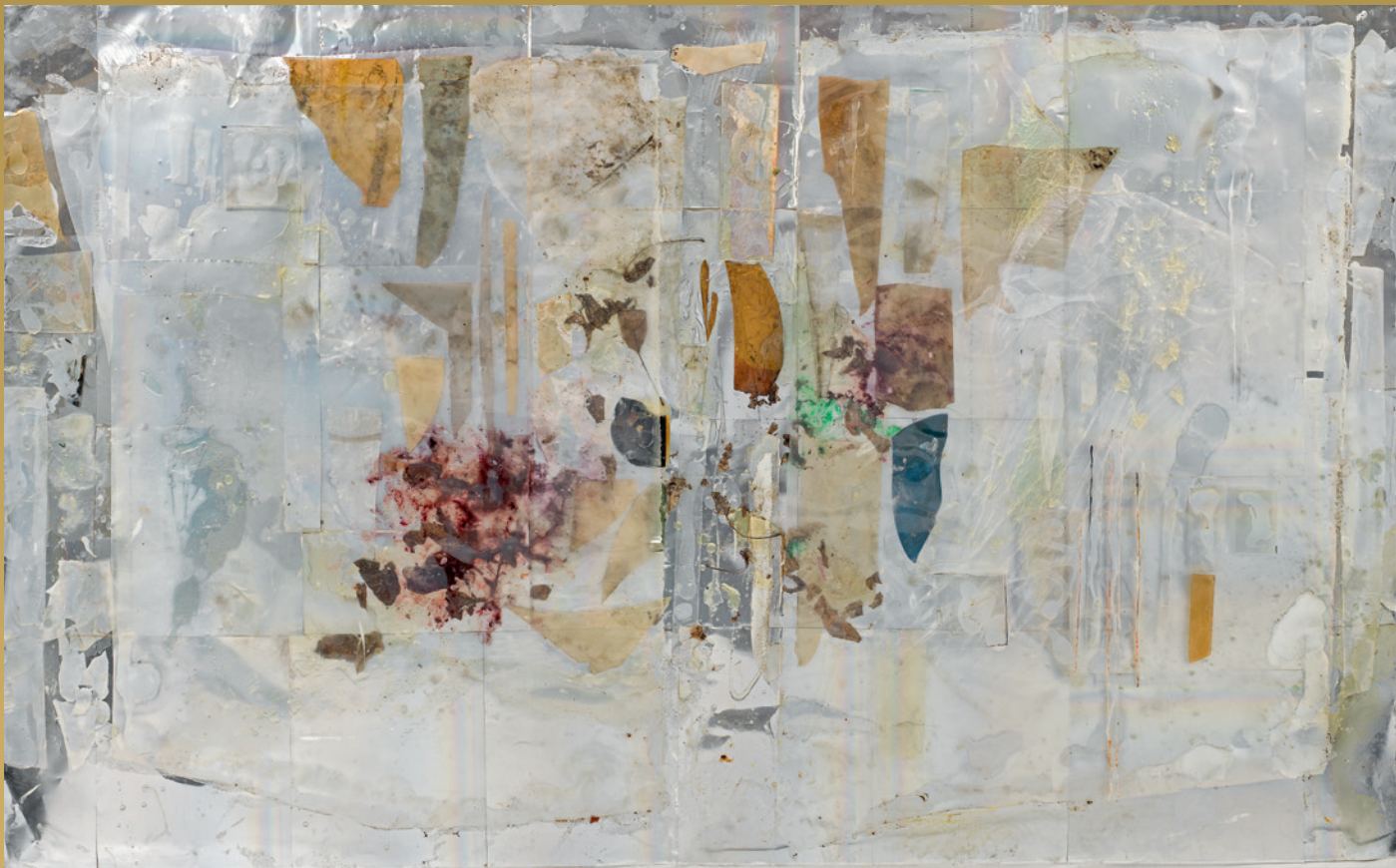
Rudolf Polanszky, Reconstructions , 2005, 170 x 269 cm Weltrekord / verkauft um € 126.000