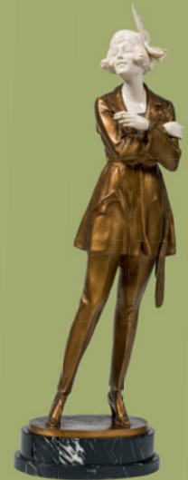
Bruno Zach verkauft um € 56.700