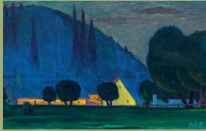
Werner Berg verkauft um € 226.800