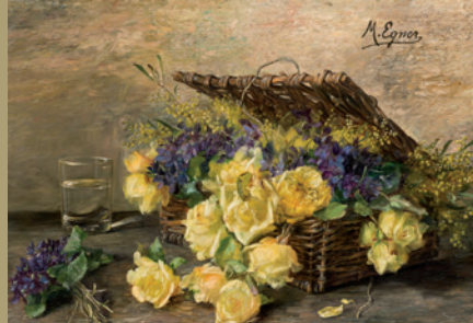
Marie Egner verkauft um € 56.700