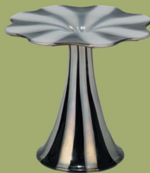
Koloman Moser verkauft um € 44.100