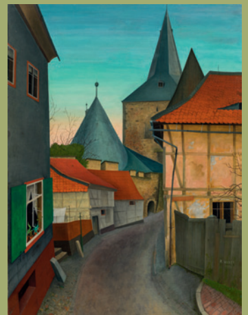
Rudolf Wacker verkauft um € 126.000