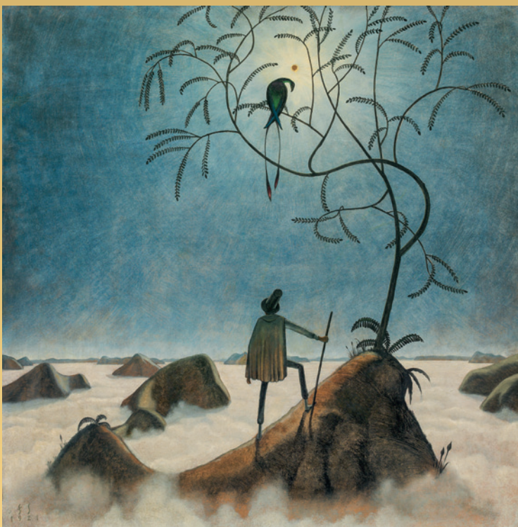
Franz Sedlacek, Landschaft mit Nebelmeer , 1921, 71 x 71 cm, Weltrekord / verkauft um € 441.000