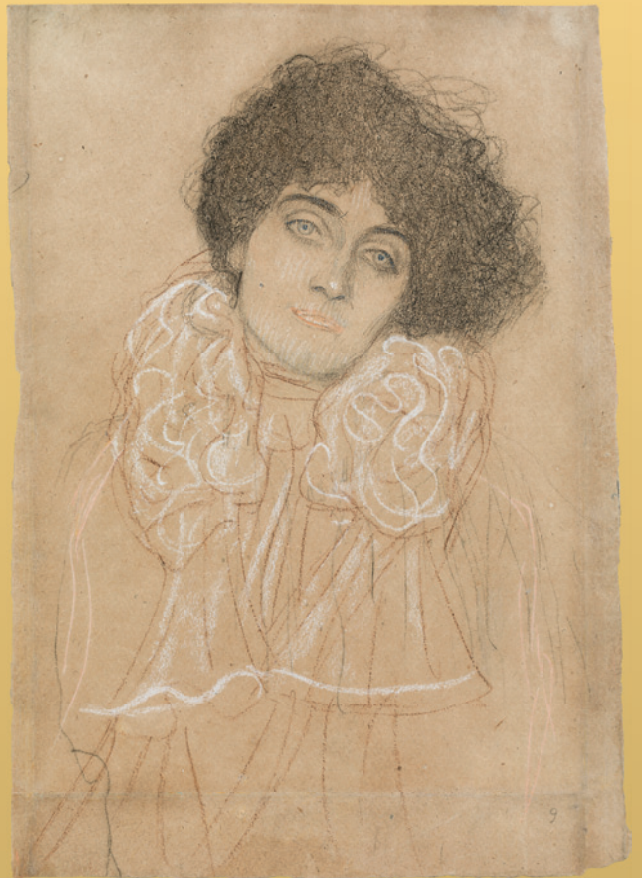
Gustav Klimt, Damenbrustbild von vorne , 1897/98, 45 x 32 cm, Österreich Rekord / verkauft um € 705.600

Rudolf Polanzkys Reconstructions sorgte im Rahmen der Zeitgenossen-Auktion für den perfekten Abschluss eines überwältigenden ersten Halbjahres, als der Hammer für sein Werk bei € 126.000 fiel - ein Preis, der den bisherigen, ebenfalls im Kinsky aufgestellten Weltrekord gleich doppelt übertraf.