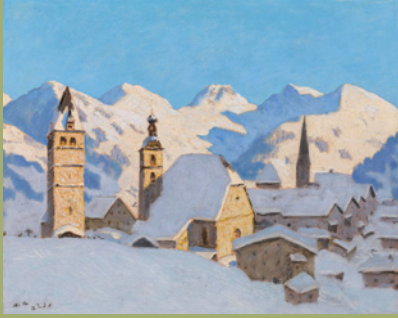
Alfons Walde verkauft um € 365.400