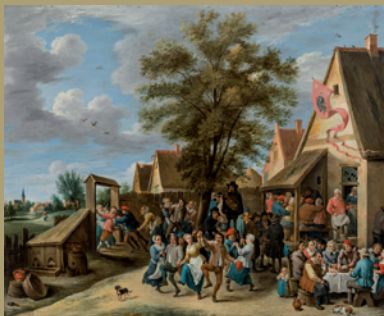
Abraham Teniers verkauft um € 88.200