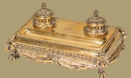
Persönliches Schreibzeug von Erzherzog Franz Ferdinand verkauft um € 23.940