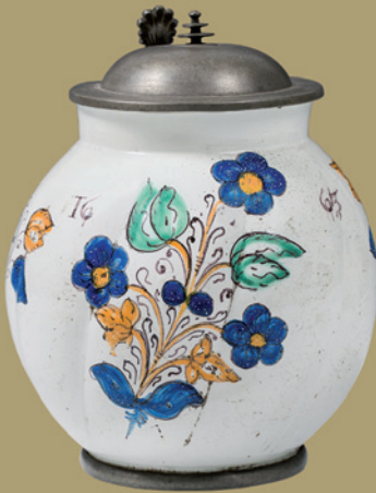
Habaner Krug verkauft um € 22.680