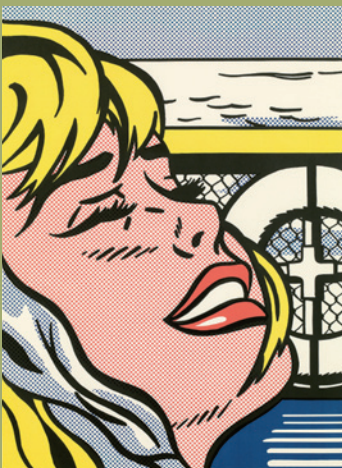
Roy Lichtenstein verkauft um € 47.880