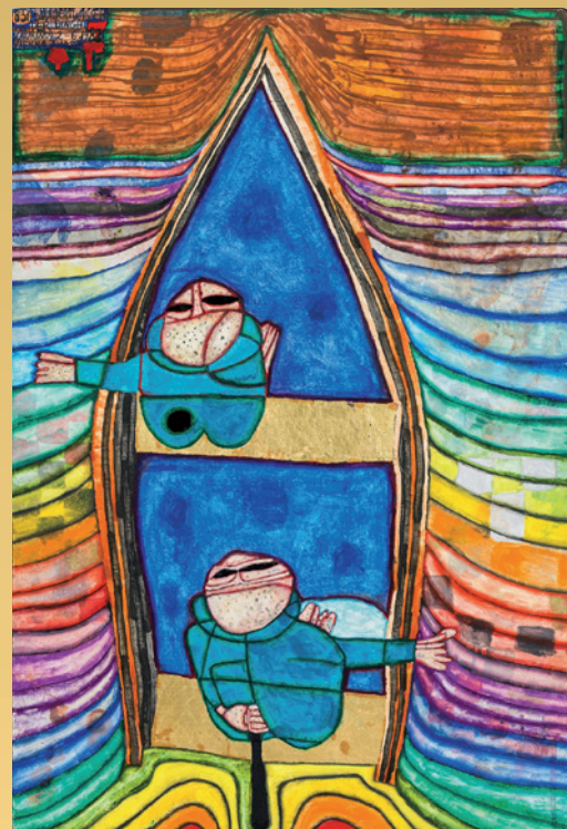
Friedensreich Hundertwasser, 831 Tender Dinghi , 1982, 64 x 43 cm Weltrekord / verkauft um € 441.000