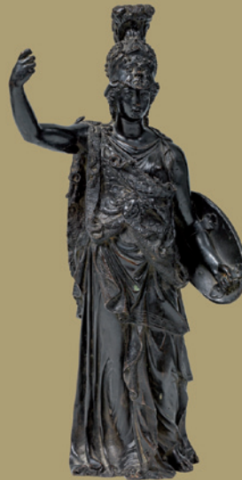
Minerva verkauft um € 132.300