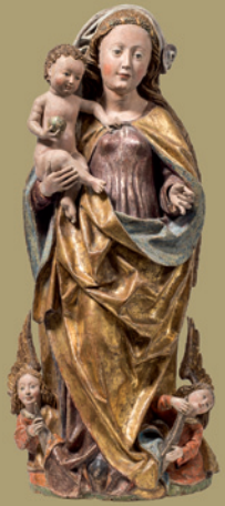
Michel Erhart Werkstatt verkauft um € 126.000