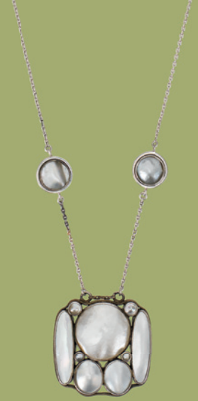
Josef Hoffmann verkauft um € 75.600