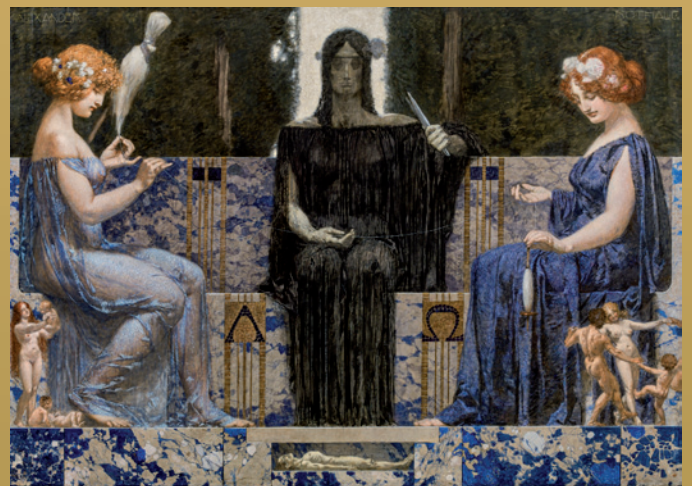
Alexander Rothaug, Die drei Parzen , um 1910, 124 x 174 cm Weltrekord / verkauft um € 189.000