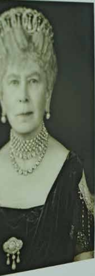
der Hochzeitsbrosche (Seite 196).