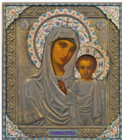
Silberkladikone "Gottesmutter von Kasan"

Sollten Sie nach sechs Wochen keine Nachricht von uns erhalten haben, bitten wir Sie, uns zwecks Rücknahme oder Reduzierung des Limitpreises zu kontaktieren.