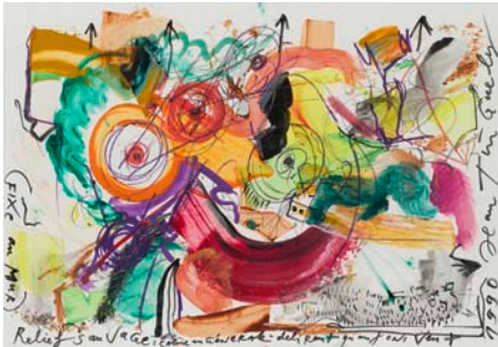
JEAN TINGUELY Fribourg 1925-1991 Bem