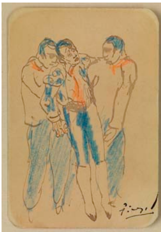
PABLO PICASSO Malaga 1881-1973 Mougins

Christie's, Amsterdam, Auktion vom 26. Mai 1993, Kat.-Nr. 280 Schweizer Privatsammlung