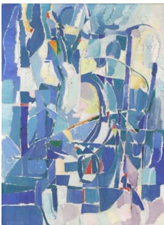
ANDRE LANSKOJ Moskau 1902-1976 Paris

Provenienz: Schweizer Privatsammlung (direkt vom Künstler erworben)