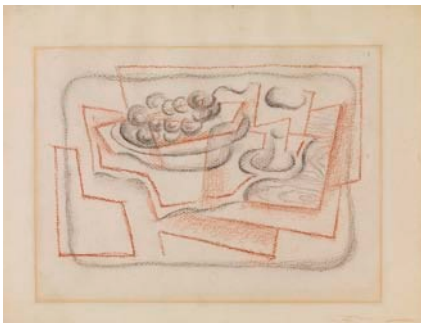
JUAN GRIS Madrid 1887-1927 Boulogne-sur-Seine