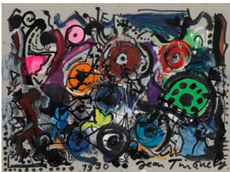
JEAN TINGUELY Fribourg 1925-1991 Bem

Provenienz: Schweizer Privatsammlung (direkt vom Künstler erworben)