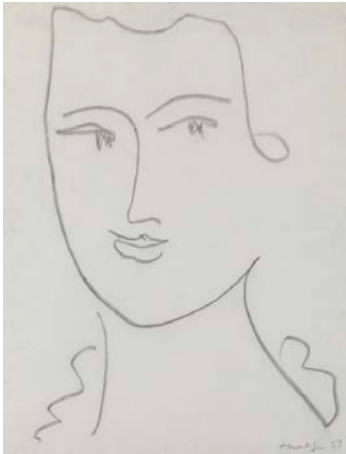
HENRI MATISSE Le Cateau 1869-1954 Cimiez (Nizza)