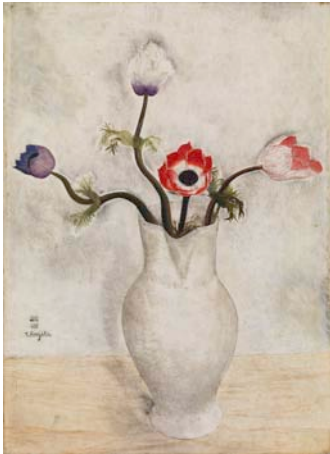
TSUGUHARU FOUJITA Edogama (Tokyo) 1886-1968 Zürich