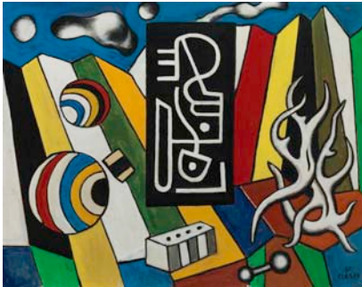
FERNAND LÉGER Argentan 1881-1955 Gif-sur-Yvette