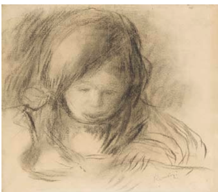
PIERRE-AUGUSTE RENOIR Limoges 1841-1919 Cagnes

Galerie Raab, Berlin Schweizer Privatsammlung