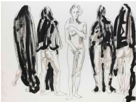
LUCIANO CASTELLI Geb. 1951 in Luzern