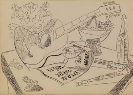
GINO SEVERINI Cortona 1883-1966 Paris