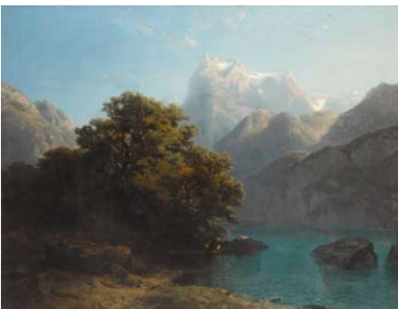
ALEXANDRE CALAME Vevey 1810-1864 Menton