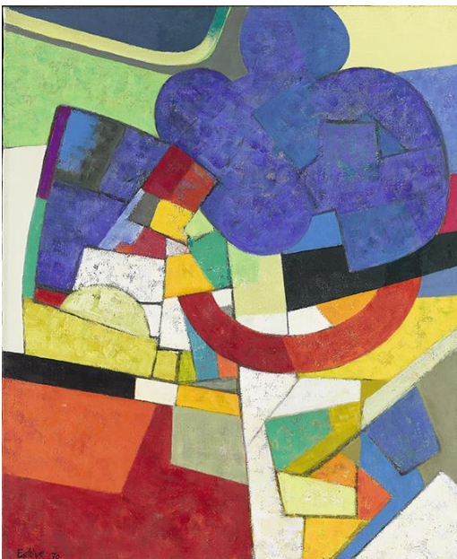
MAURICE ESTÈVE Culan 1904-2001 Culan

Provenienz: Löhr Kunsthandel, Mönchengladbach Schweizer Privatsammlung (von oben genannter Kunsthandlung im Jahr 2000 erworben)