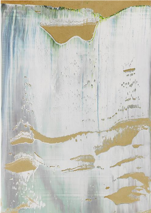
GERHARD RICHTER Geb. 1932 in Dresden

Vorbesichtigung: 14. bis 22. November 2015 (täglich durchgehend 10.00 bis 18.00 Uhr, auch Sa & So)