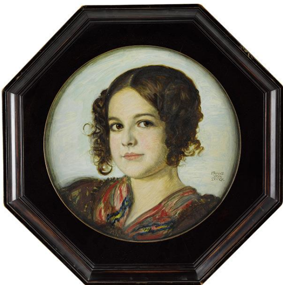
FRANZ VON STUCK Tettenweis bei Passau 1863 – 1928 München

Schweizer Privatsammlung (direkt vom Künstler erworben)