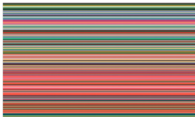
STRIP III, 2013, Digitaler Inkjetdruck zwischen Acrylglas, 60 x 110 cm

Mit dem Hund von 1965, einem Siebdruck in bläulichem Schwarz auf weißem, manuell aufgetragenerem Fond, beginnt Richters Werk der Editionen in genau diesem Geist. Über 185 Aufgabensätze, die seitdem entstanden sind, loten die Bedingungen der Bildsprache aus. Dabei bedient Richter sich klassischer Sujets wie der Landschaft oder des Porträts. Er verarbeitet, inspiriert von amerikanischer Pop-Art, Motive aus den Massenmedien, untersucht das Verhältnis von Abstraktion zu Figuration, von Bild zu Abbild oder experimentiert mit optischer Erscheinung und haptischer Dinghaftigkeit. Im Rahmen dieser Auseinandersetzung mit der Frage nach dem Bild hat sich Gerhard Richter auf beinahe alle künstlerischen Gattungen eingelassen. Gerhard Richters Editionen sind keineswegs losgelöst von der Malerei zu verstehen, sondern gehören wesentlich zum Arbeitsprozess. So erprobt er die Möglichkeiten und Wirkweisen verschiedener Bildmedien und -gattungen und hinterfragt sein Selbstverständnis als Künstler. Manchmal denke ich, ich sollte mich nicht Maler nennen, sondern Bildermacher. Ich bin mehr an Bildern interessiert als an Malerei. Dieses Selbstverständnis äußert sich in einem umfangreichen Werk, das künstlerische Medien in sowohl technischer als auch motivischer Breite durchdekliniert. Sein Umgang mit den unter-