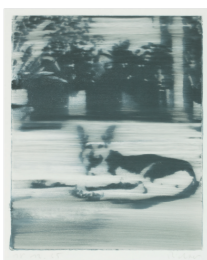
Hund, 1965, Siebdruck, 37,5 x 30,5 cm

schiedlichsten Verfahren der Druckgrafik, Fotografie und Malerei zeugt von unbändiger Neugier und Experimentierfreude. Gleichzeitig kommentieren und reflektieren die Editionen in Form von wechselseitigen Konzepten, künstlerischen Strategien und Themen sein malerisches Œuvre. Ohne Übertreibung kann er wohl als einer der vielfältigsten Künstler unserer Zeit gelten.