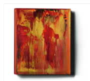
War Out II, 2005, Vorkursausgabe des gleichnamigen Buches, mit Ötfarben überakelt, 25,5 x 21,8 cm

schiedlichsten Verfahren der Druckgrafik, Fotografie und Malerei zeugt von unbändiger Neugier und Experimentierfreude. Gleichzeitig kommentieren und reflektieren die Editionen in Form von wechselseitigen Konzepten, künstlerischen Strategien und Themen sein malerisches Œuvre. Ohne Übertreibung kann er wohl als einer der vielfältigsten Künstler unserer Zeit gelten.