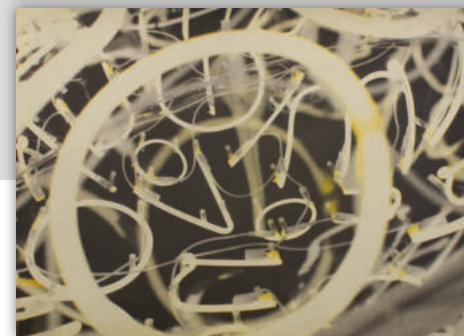
links unten: Kowanz, Brigitte: „Volumen“, Polymerheliogravüre, 50 Stück, 2016; € 580,-