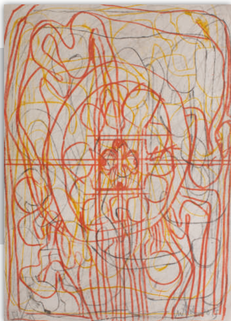
Nitsch, Hermann: „O.T.“, Lithographie, 75 Stück, 2015; € 930,-