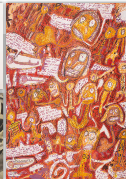
rechts: Pongratz, Peter: „Sweet Home Vienna“, Strichradierung, Vernis mou, Aquatinta, Zuckertusche, Schmirgelpapier, 75 Stück, 2004; € 540,-